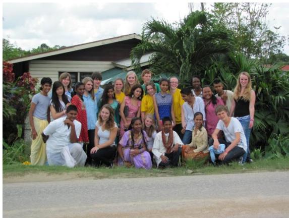
Groepsfoto op de dag laatste dag op school. De Surinaamse leerlingen hebben de traditionele kleding aan van alle bevolkingsgroepen in Suriname.