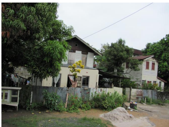
Zomaar een paar huizen zoals je ze veel ziet onderweg.

Het verschil in rijkdom tussen Nederland en Suriname is het thema dat het meeste leeft. Armoede wordt door veel leerlingen genoemd. Meerdere leerlingen vonden het land rijker dan ze hadden gedacht, zij dachten van tevoren dat iederéén arm zou zijn. Maar, zoals een meisje vertelt: “Wat ik heb gezien zijn grote verschillen. Een dikke villa en dan weer een krot”. Anderen benoemen meer dat ze opvalt hoe Surinamers omgaan met geld en goed. “Ze wonen in kleine huizen, maar dat vinden ze niet erg. En “misschien hebben ze niet zoveel, maar ze zijn supergelukkig met wat ze hebben. En dan nog delen ze dingen met je, dat is wel heel bijzonder.” De waarde van geld bleek een jongen ook heel duidelijk toen hij aan me vertelde: “Ik kocht wat te drinken en zei tegen de man ‘laat het wisselgeld maar zitten’. De man keek helemaal verbaasd en vroeg ‘Weet je het zeker?’”