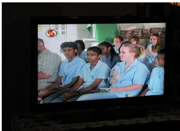
De leerlingen op het Surinaamse Jeugdjournaal (foto van de televisie-uitzending op 25 januari 2012)

Wie een plaats in de groep vindt die hem of haar past, kan opeens een echte groeispurt maken, zo observeerden de teamcoaches bij een leerling: “Hij kreeg een taak die hem paste en we zággen ‘m gewoon groeien. Het is een ander joch geworden, van een passieveling tot een actieveling”. De teamcoaches vinden ook communicatie (onderling, maar ook met volwassenen) een grote verandering in de groep. Ze zien dat leerlingen beter dan thuis luisteren naar elkaar, volwassener communiceren en hun verantwoordelijkheid nemen.