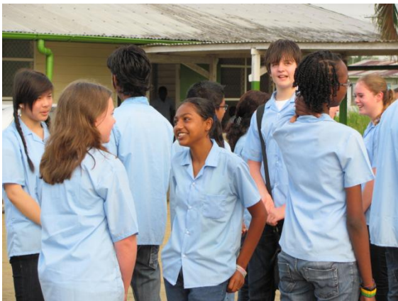
De aankomst op de eerste dag: eerst een kennismakingspel.

Het Corlaer College (christelijke scholengemeenschap voor vmbo, havo en vwo in Nijkerk) is zo langzamerhand een traditie aan het opbouwen van leerlingen die naar verre landen afreizen. Eerst was er de Expeditie durven, delen, doen (innovatieproject van de VO-raad van 2007 tot 2010). Acht leerlingenteams hebben projecten opgezet in allerlei landen onder het motto 'Uitblinken, met oog voor de ander'. De succesvolle ervaringen uit de Expeditie durven delen doen, wil de school niet verloren laten gaan en daarom wordt het concept Expeditieonderwijs doorgezet in een eenjarige variant. In het schooljaar 2011/12 werken vijf leerlingenteams aan projecten die het doel hebben de wereld een stukje te verbeteren.