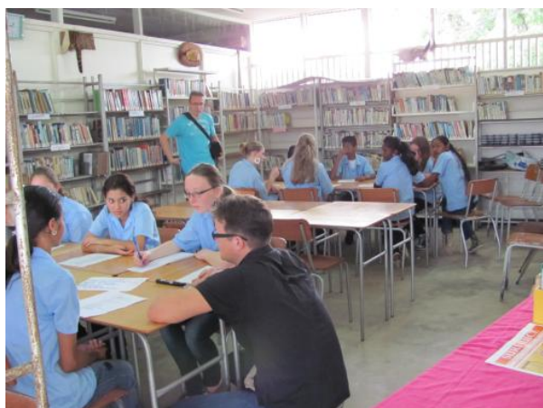
In groepen aan het werk op de Anton Resida school.

Leerlingen lieten op meerdere momenten zien dat ze zich verplaatsten in de Surinaamse medeleerlingen. De teamcoaches noemen als voorbeeld hiervan dat de leerlingen er echt rekening mee hielden dat de meeste Surinaamse leerlingen weinig geld hebben. De meisjes die wilden gaan shoppen in Paramaribo deden dat daarom liever zonder de Surinaamse leerlingen erbij, omdat ze het moeilijk vonden (relatief) veel geld uit te geven in hun bijzijn. Op de laatste dag werd er alsnog wel geshopt in duo's van Surinaamse en Nederlandse leerlingen, maar de meeste inkopen waren toen al gedaan. De Nederlandse leerlingen trakteerden hun Surinaamse winkelgenoot bij de McDonald's. Een enkeling heeft overwogen om de rest van haar Surinaamse geld aan haar shopgenoot te geven.