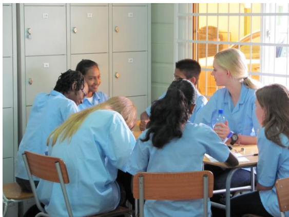
Overleg over de webwinkel en de taakverdeling.

Ook het ontbreken van grove taal, geschreeuw, geduw en getrek op school noemden een aantal meisjes als een groot verschil met het Corlaer College. “Ik voel me gewoon thuis hier!” vertelde een leerling op het jeugdjournaal.